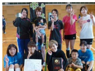
小京都が3連覇達成！