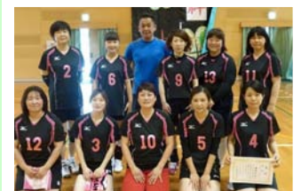
2部優勝の御堀町内会