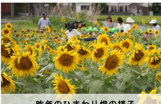
昨年ひまわり畑の様子