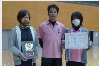
混合の部優勝の下千坊Aの皆さん