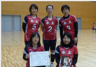
女子の部優勝の氷上Aの皆さん