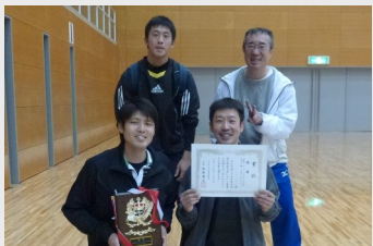
男子の部優勝の中矢田Cの皆さん