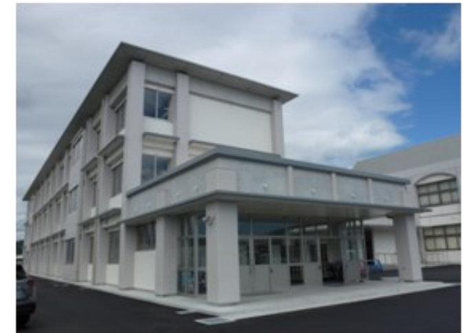
新しい新校舎→ ←特急マスコットのレプリカ

そして、この度ついに新校舎が完成し、2学期から使用が開始されました。新校舎の面積は1,586㎡で、主に理科室と3年生の教室として使用されることとなります。