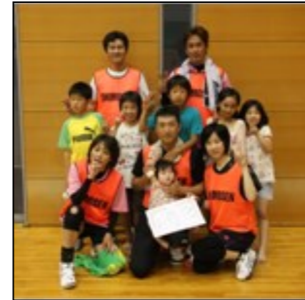
混合(上位)優勝：下千坊Aチーム

5月26日(日)、山口リフレッシュパークにおいて、大内地区前期ソフトバレーボール大会が開催されました。