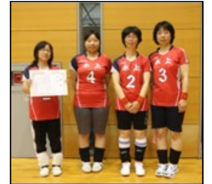
↑女子優勝：水上新Aチーム