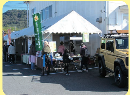
食生活改善推進協議会山口支部大内地区では、アルファ米の試食がありました。