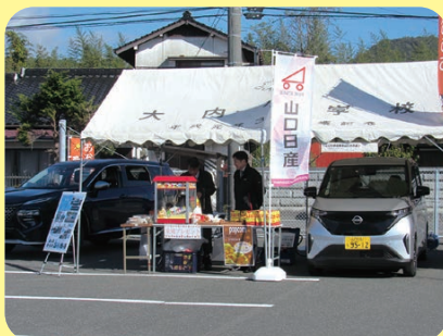
山口日産自動車(株)山口大内店では、電気自動車を使ってポップコーンを作り、来場者に配布されていました。