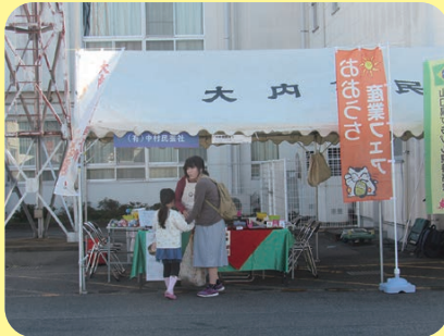
中村民芸社では、大内人形の材料を用いた絵付け体験がありました。