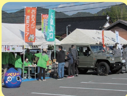
山口県建設労働組合山口支部では、プロの大工さんの指導の下、親子木工教室が行われていました。