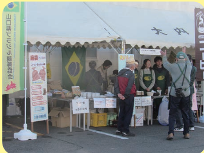
山口県ブラジル親善協会では、ブラジルコーヒーの販売がありました。