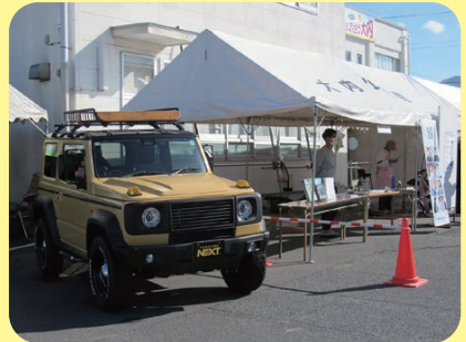
(株)ミッドフォーでは、3つの事業紹介と、車の展示もありました。