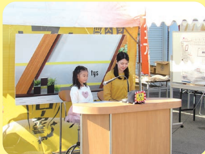
tysテレビ山口では、アナウンサー体験がありました。