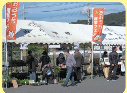
JA山口県大内支所葉ボタンの会では、葉ボタンや花の苗の販売がありました。