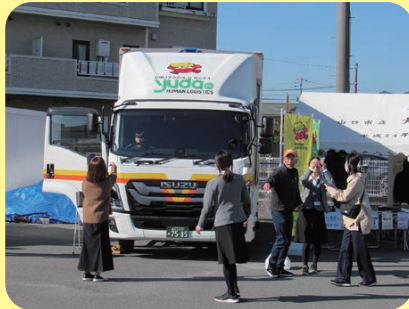
(株)「ゆだ」では事業紹介だけでなく、トラックを展示し、乗車体験もありました。