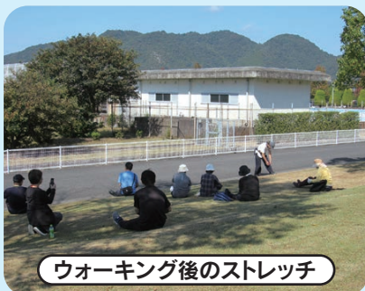
ウォーキング後のストレッチ