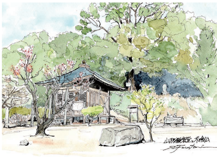
氷上地区にある山根観音堂

本誌33号（令和3年7月号）でも山根観音堂と木喰仏を紹介していますが、山根観音堂は、氷上山興隆寺の観音堂を、明治17年にここに移築したものです。 この観音堂の中に安置されているのが聖観音菩薩で、県指定の文化財です。平安時代末の作と言われておりますが、日頃は観音堂は閉まっているので、格子の隙間からしか見ることはできません。観音堂を管理されている地元の方に連絡すれば、開けてもご覧いただけます。 観音堂の後方の楠の太木には、江戸時代後期の行脚僧、木喰上人の作とされる立木仏があり、今は太木に優しく包み込まれています。 左のイラストは古谷眞之助さんの作です。素敵なイラストを、いつもありがとうございます。