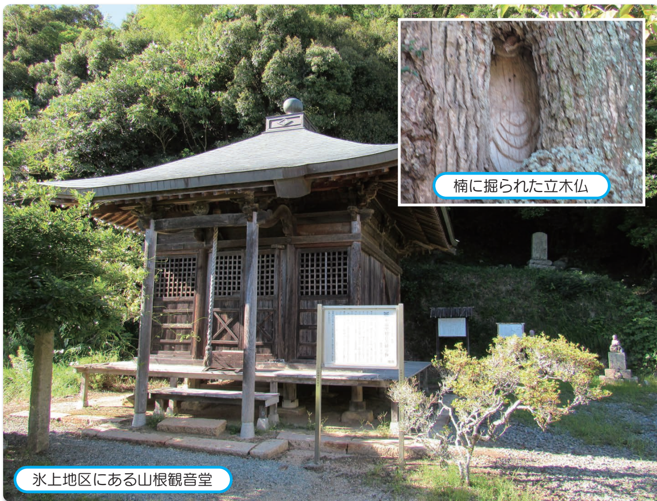
楠に掘られた立木仏